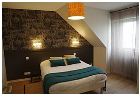
Relais du Mené