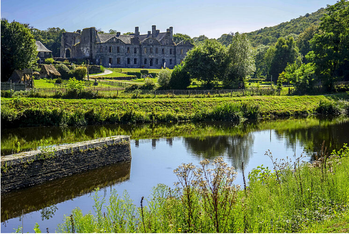
22, Abbaye de Bon Repos, Aurélie Stapf, Bretagne, Côtes-d'Armor, EVI, Europe, France, La Vélodyssée, Photographie, itinéraire, photographe, voie verte, vélo, véloroute, 22, Abbaye de Bon Repos, Aurélie Stapf, Bretagne, Côtes-d'Armor, EVI, Europe, France, La Vélodyssée, Photographie, itinéraire, photographe, voie verte, vélo, véloroute