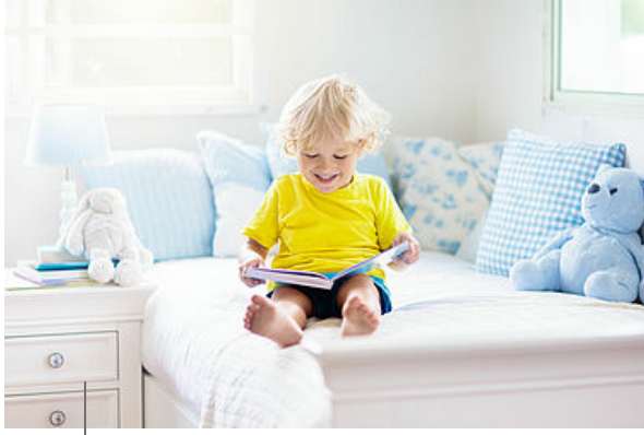
Bébé lecteur